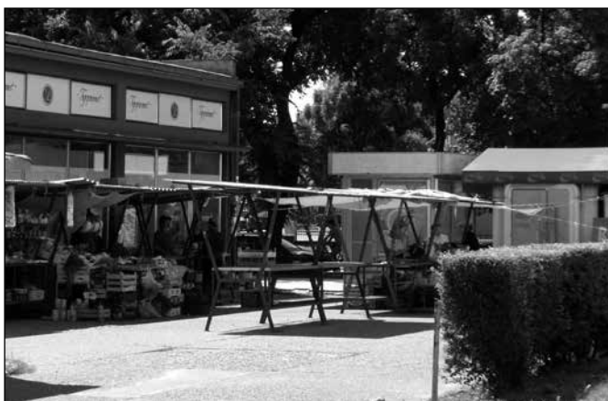
Pijaca kod Elektrovojdovine

Inspekcije redovno kontrolišu rad JKP, ali i zakupce odnosno prodavce, pa želim upozoriti sve naše zakupce, da i oni sami su dužni čuvati red oko svojih prodajnih mesta i takođe treba da poštuju odredbe gradske Odluke o pijačnom redu: dakle treba da poštuju predviđeno radno vreme i ne mogu zauzeti veću /javnu/ površinu od odobrenog. Takođe samovoljno ne mogu menjati ni asortiman robe, dakle, ako su zakupili prodajno mesto za prodaju voća i povrća, onda na datom mestu ne smeju prodavati mešovitu robu.