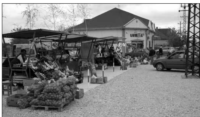
Pijaca kod Zorke

Inspekcije redovno kontrolišu rad JKP, ali i zakupce odnosno prodavce, pa želim upozoriti sve naše zakupce, da i oni sami su dužni čuvati red oko svojih prodajnih mesta i takođe treba da poštuju odredbe gradske Odluke o pijačnom redu: dakle treba da poštuju predviđeno radno vreme i ne mogu zauzeti veću /javnu/ površinu od odobrenog. Takođe samovoljno ne mogu menjati ni asortiman robe, dakle, ako su zakupili prodajno mesto za prodaju voća i povrća, onda na datom mestu ne smeju prodavati mešovitu robu.