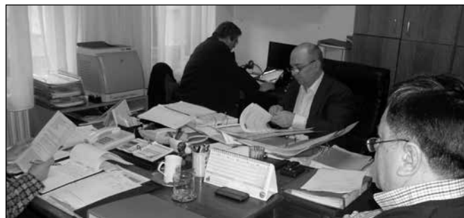
Sa prošlogodišnje provere

Mislim, da smo u proteklih godinu dana učinili sve radi adekvatnog funkcionisanja sistema za upravljanje kvalitetom, i nadam se da nema nikakvih prepreka da proveravači „Certop“-a potvrde sertifikat izdat za JKP „Subotičke pijace“ na još jednu godinu.